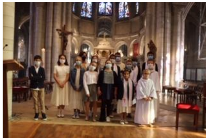
Samedi 10 octobre à la Collégiale de Vernon